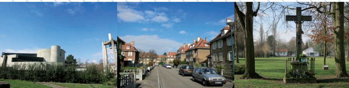
L'église Saint François d'Assise