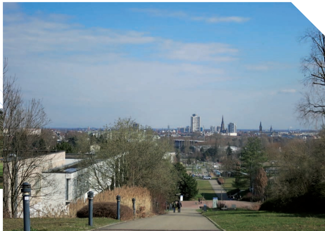
Place de la croix bleue

D'autres circuits de randonnée sont disponibles à l'Office de Tourisme de Mulhouse et sa région et téléchargeables sur www.mulhouse-alsace.fr/fr/deplacements